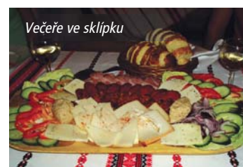
Večere ve sklípku