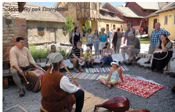
Středověký park Élménybirtok

Klienti s vlastní dopravou mohou v některých typech ubytování volit libovolnou délku pobytu od 3 noclehů výše. Klienti s dopravou autobusem si mohou prodloužit pobyt o další týden, příplatek za dopravu je stejný jako u pobytu na týden. Bližší informace žádejte v CK.