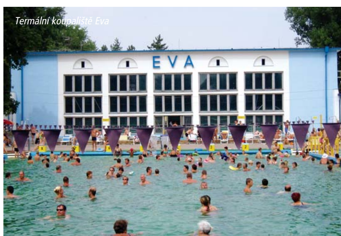
Termální koupaliště Eva

Bazén naplněný přírodní termální sírnou minerální vodou s teplotou 38°C.